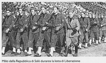
Militi della Repubblica di Salò durante la lotta di Liberazione