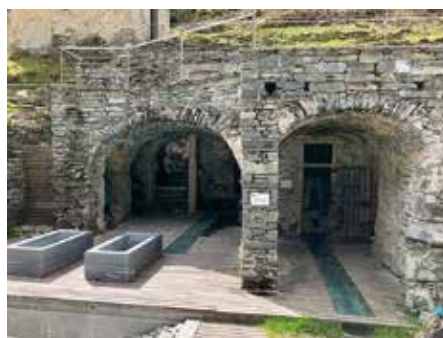
Die Bagni di Craveggia

Revelli war Zeit seines Lebens ein überzeugter Antifaschist, nichtsdestotrotz warfen ihm ExponentInnen des Partito comunista vor, die moralische Klarheit des antifaschistischen Kampfes zu verwischen. Revellis Reaktion darauf: Er kritisierte nicht den Widerstand, der notwendig war, sondern den Mythos, der ihn verklärt. Revelli will zeigen, dass bei den ca. 100'000 PartisanInnen, die sich vom Heer der 800'000 italienischen Soldaten, die nach dem Waffenstillstand