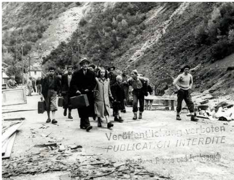
Flüchtlinge aus dem Ossolagebiet beim Grenzübertritt in Gondo (VS), 1. Oktober 1944.

on um die Rolle der Schweiz im Zweiten Weltkrieg ein, und es befasst sich gleichzeitig mit der Bedeutung der Resistenza in Italien. Und es fokussiert, wie die Autoren zeigen, nicht auf die Regierungsebene, sondern befasst sich mit der Bevölkerung, mit den Menschen, die auf ganz unterschiedliche Weise vom Krieg betroffen waren und in das Geschehen zu intervenieren versuchten.